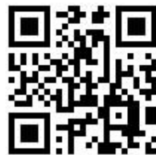
高雄住宅補貼 行動專區